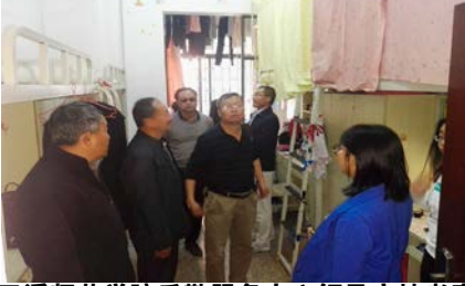
玉溪师范学院后勤服务中心领导实地考察我校学生公寓

大学生思想政治工作、聘用人员管理等问题进一步交流经验并达成共识，学生公寓管理部门应该逐步完善岗位培训制度，树立文明向上的学风，全面提高工作人员的文化水平和管理服务能力；加大学生公寓各项管理制度的监督、监管力度，保证各项制度的落实和岗位职责的履行。