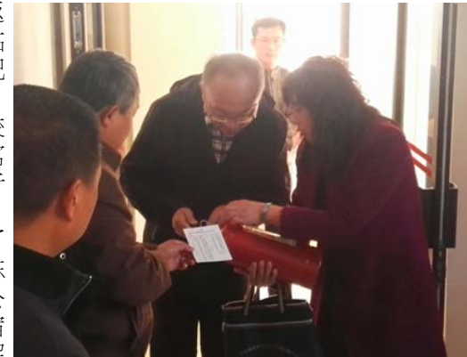
学生公寓管理中心 2018年3月6日

随着春风轻拂大地，呈贡校区在绚丽盛开的樱花映衬中拉开新学期... 进行了详细汇报，公寓管理中心充分利用假期和收假前夕，抓紧时间修缮宿舍，力求排除一切会对同... 学生生活造成影响的因素，为返校同学提供舒适整洁的住宿环境。